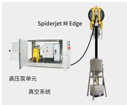
整个系统的简单设置