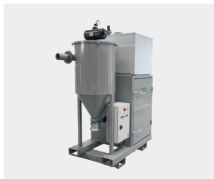
与许多常规真空系统兼容